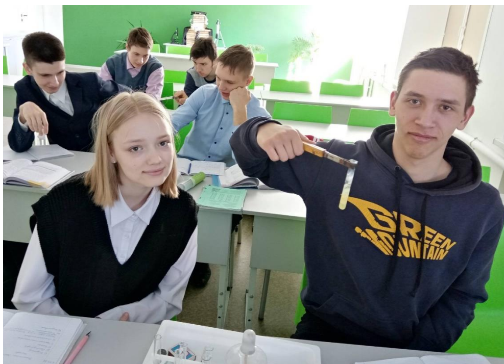
Опыт 2 «Ксантопротеиновая реакция»