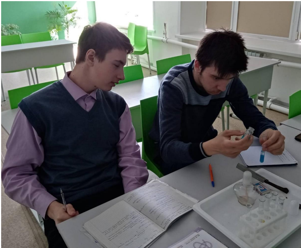
Опыт 3 «Биуретовая реакция»