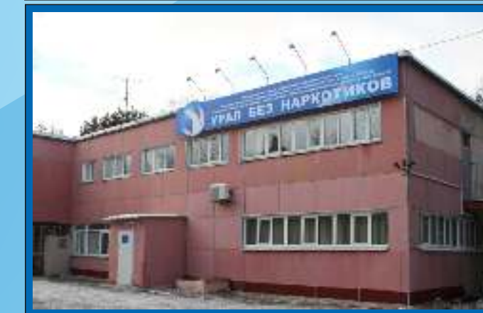
Отделение медицинской реабилитации №3 Свердловская область, г. Каменск-Уральский