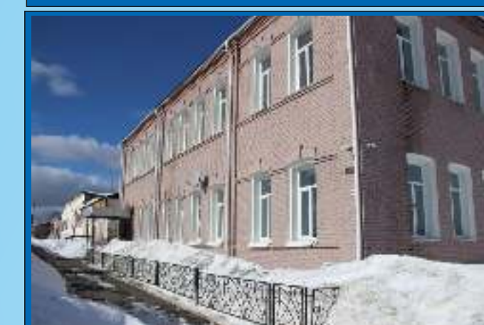
Отделение медицинской реабилитации №2 Свердловская область, г. Карпинск