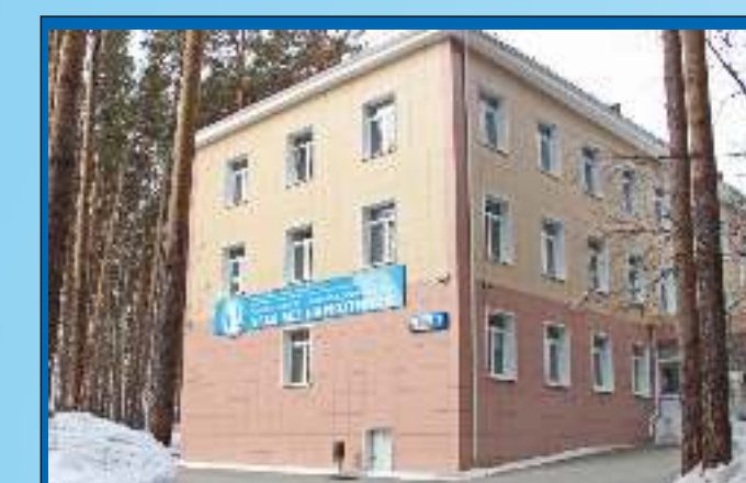
Отделение медицинской реабилитации №1 Свердловская область, г. Екатеринбург