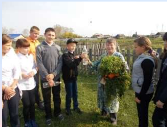
Акция «Родниковая вода в ваш дом»