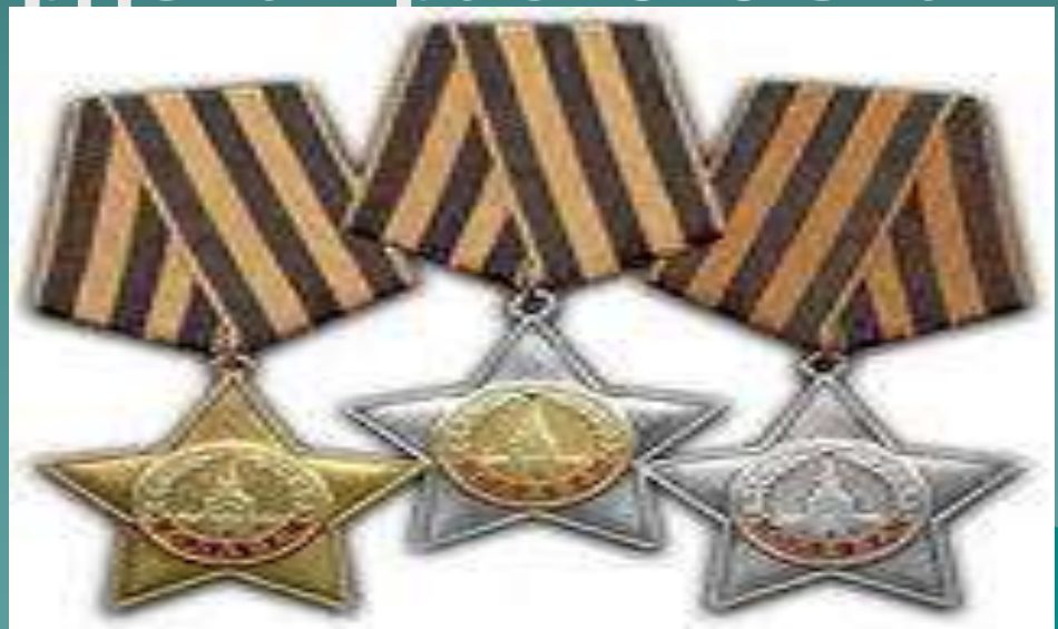
Ордена славы трех степеней