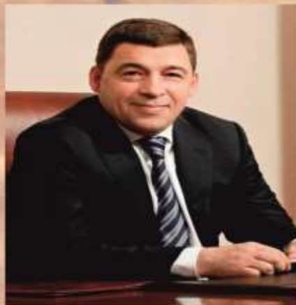
Губернатор Свердловской области Куйвашев Евгений Владимирович

Губернатор Свердловской области Указом БЛАГОСЛОВИЛ традиции Корпуса В БЕССМЕРТИЕ