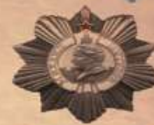
ОРДЕН КУТУЗОВА II степени

10-ый Гвардейский, Уральско-Львовский, Краснознаменный, Орденов Суворова и Кутузова, Добровольческий танковый Корпус.