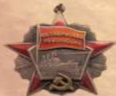
ОРДЕН ОКТЯБРЬСКОЙ РЕВОЛЮЦИИ