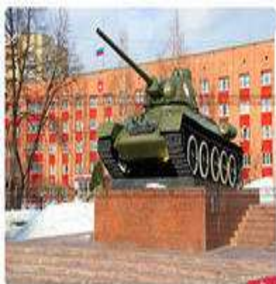
Панорама Уральского добровольческого танкового корпуса в Перми.