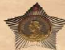
ОРДЕН СУВОРОВА II степени